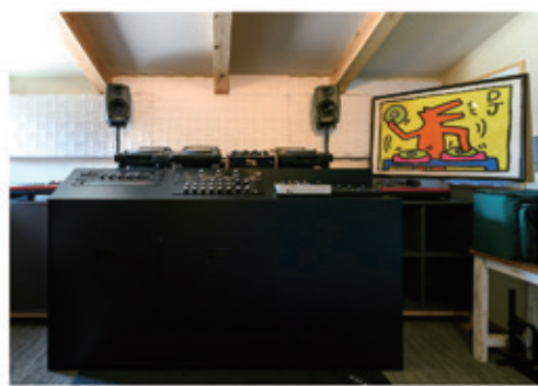
DJブースの壁は防音材を使用し、音漏れ対策もバッチリ