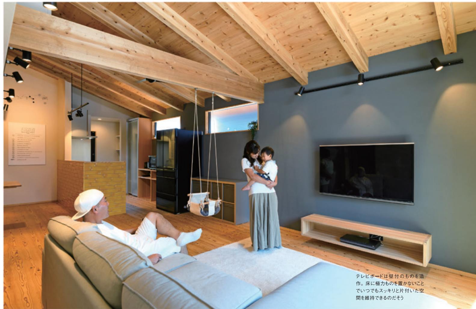
テレビボードは壁付のものを造作。床に極力ものを置かないことでいつでもスッキリと片付いた空間を維持できるのだそう