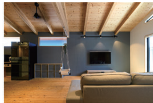
グレーのアクセントウォールを採用。モダンな雰囲気