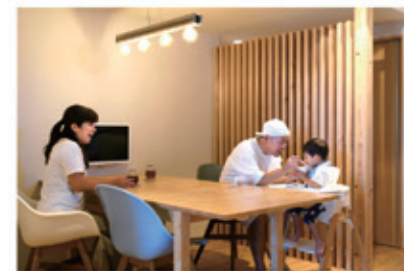
ダイニングは木格子を設置し、「お籠り感」を演出